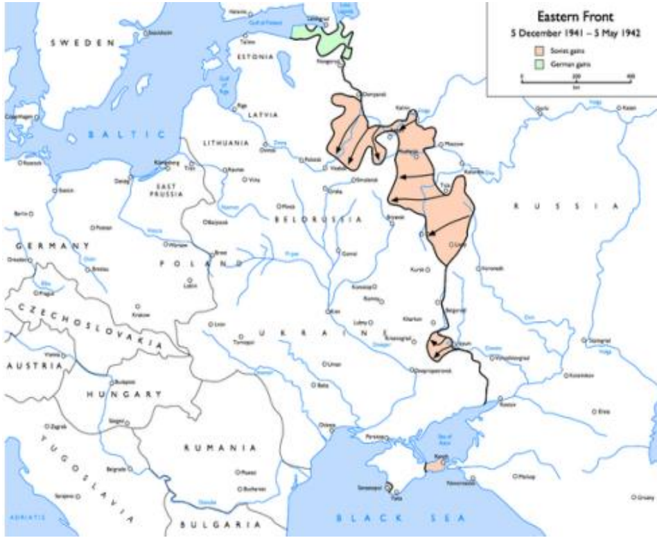
Resim 2: 5 Aralık 1941-7 Mayıs 1942. Sovyet taarruzları (Yılmaz, 2019, s. 73)