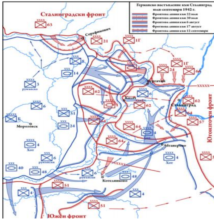
Resim 3: Stalingrad Taarruzu (Yılmaz, 2019, s. 132)

23 Ağustos 1942'nin akşamında B Ordular Grubu Volga kıyılarına ulaşmış, 30 Ağustos'ta Stalingrad'ı kuşatma operasyonu tamamlanmıştır. 3 Eylül'de Sovyet kuvvetleri mevzilerinden ayrılarak şehrin iç bölgelerine çekilmek zorunda kalmış, ertesi gün on dördüncü Alman Kolordusuna yönelik taarruz başlatmışlardır. Burada 120 Kızıl Ordu tankının otuzu Alman hava kuvvetleri tarafından yok edilmiştir. 7 Eylül'de şehrin havaalanı Alman kuvvetlerinin eline geçmiş, iki gün sonra Moskova-Astrahan demiryolu hattı kesilmiştir. Eylül ayında şehirdeki Alman ilerlemesi sürmüştü, Kızıl Ordu kuvvetleri sürekli gerilemek zorunda kalmışlardır. Muharebenin üçüncü ayında ilerleme yavaşlamış, Almanlar Volga'nın batı kıyılarına ulaşmışlardır (Yılmaz, 2019, s. 132-133).