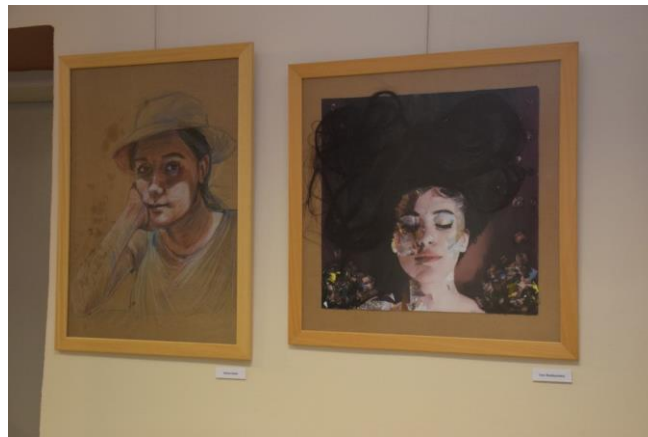
Resim 2. Anadolu Üniversitesi Güzel Sanatlar Fakültesi Öğrenci Sergisi, 2016-2017

Üniversitelerde yapılan sanat etkinliklerinden örnekler vermek gerekirse, ev tekstilinde moda yaratabilecek tasarım ve tasarımcıların ortaya çıkmasını sağlamak amacıyla Zorluteks tarafından 18 Mart 2016'da düzenlenen yarışmanın ilanında güzel sanatlar fakültelerinde okuyan öğrencilerin katılabileceği öngörülmektedir. Bu yarışmalar öğrencilerin yaratıcılıkları geliştirme olacağı buldukları platformlardır. Bu yarışmalar sayesinde pratik düşünebilme, doğru akıl yürütebilme yetilerini geliştirmektedirler.