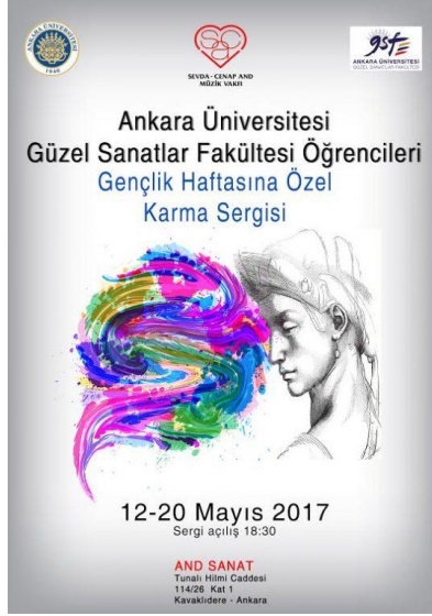
Resim 3. Ankara Üniversitesi Sergi Afişi, 2017

Anadolu Üniversitesi Güzel Sanatlar fakültesinin 2016-2017 yılında gerçekleştirdiği öğrenci sergisi yapıldı. Bu sergide amaç, sene boyunca yapılan çalışmaların sene sonunda sanatseverlere tanıtılmıştır. Bu sergilerin amacı sanat eğitimi alan öğrencilerin nasıl eserler ortaya koyduğu olmaktadır.