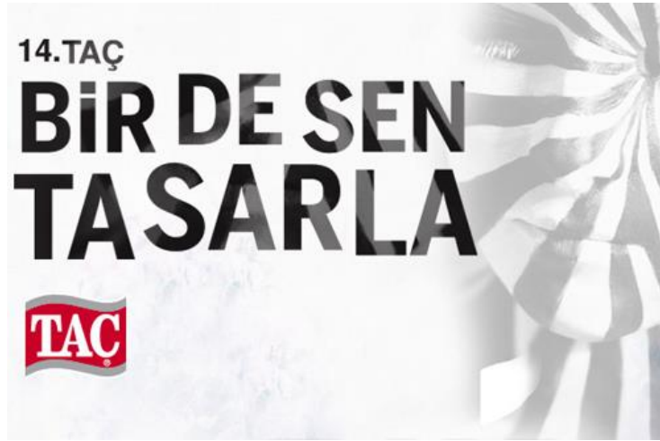
Resim 1. 14. Taç Yarışma Afışı

genellikle bir konu altında yapılan etkinliklerdir. O temaya uygun resim, heykel, seramik, vb. alanlarda yapılmaktadır. Örneğin, desen yarışmaları, üniversitelerde sanat ve tasarım fakültelerinde yapılmaktadır. Fakültelerin moda tasarımı bölümlerinde desen yarışmalarını sıklıkla görmekteyiz.